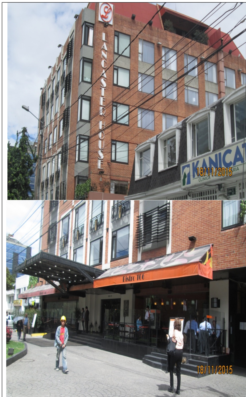
Fotografía No. 2: Avisos del HOTEL LANCASTER HOUSE de la sociedad CORPHOTELES LTDA, no está permitido colocar avisos pintados o incorporados en cualquier forma a las ventanas o puertas de la edificación y el elemento se encuentra instalado en espacio público, ubicado en la Avenida Carrera 45 No. 106 B - 28.